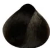
5.3 - Castanho Claro Dourado