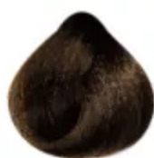
6.0 - Louro Escuro