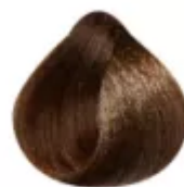
7.31 - Louro Médio Bege