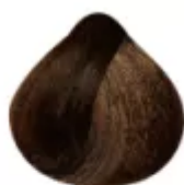
6.41 - Louro Escuro Cobre Acinzentado