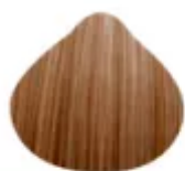
9.3/10.89 - Castanho Claro com Loiro Dourado