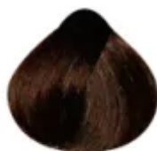
6.53 - Louro Escuro Mogno Dourado