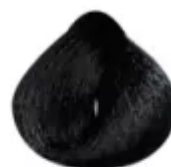
1B - Preto Azulado