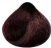
6.56 - Vermelho