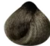
7.1 - Louro Médio Acinzentado

O procedimento não é tão difícil quanto se parece, lembrando que esta é apenas uma forma de várias que podemos aplicar o mega, mas com certeza os cuidados que devemos ter com o cabelo após aplicado, é muito maior.