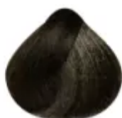
6.713 - Louro Escuro Marrom Mate