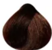
5.53 - Castanho Claro Mogno Dourado