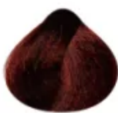
7.46 - Louro Médio Cobre Vermelho