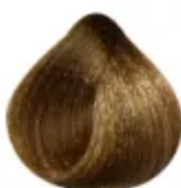
8.3 - Louro Claro Dourado