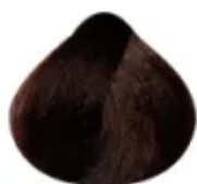
6.47 - Louro Escuro Cobre Marrom