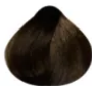
6.3 - Louro Escuro Dourado