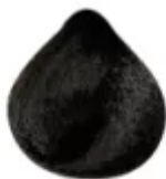
3.0 - Castanho Escuro