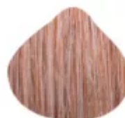
8.3/10.89 - Castanho Médio com Loiro Dourado