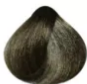
8.71 - Louro Claro Marrom Acinzentado