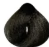
4.0 - Castanho Médio