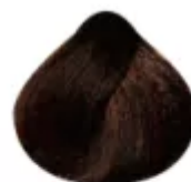
5.4 - Castanho Claro