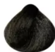
6.1 - Louro Escuro Acinzentado