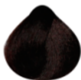
6.5 - Louro Escuro Mogno