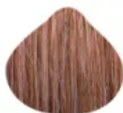
6.7/10.89 - Castanho Chocolate com Loiro Dourado