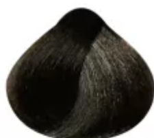
6.71 - Louro Escuro Marrom Acinzentado