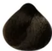
5.713 - Castanho Claro Marrom Mate