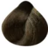
7.713 - Louro Médio Marrom Mate