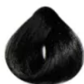
1.0 - Preto