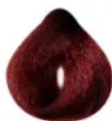
6.68 - Cereja