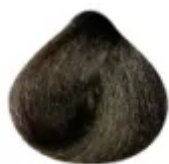
5.0 - Castanho Claro