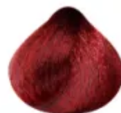
7.66 - Vermelho Intenso