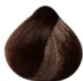
7.47 - Louro Médio Cobre Marrom