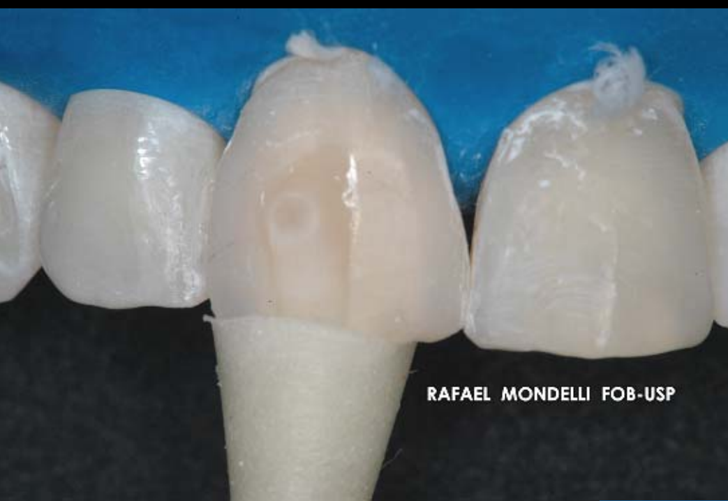
Figura 12 – Polimento com ponta em forma de taça Enhance e gel lubrificante.