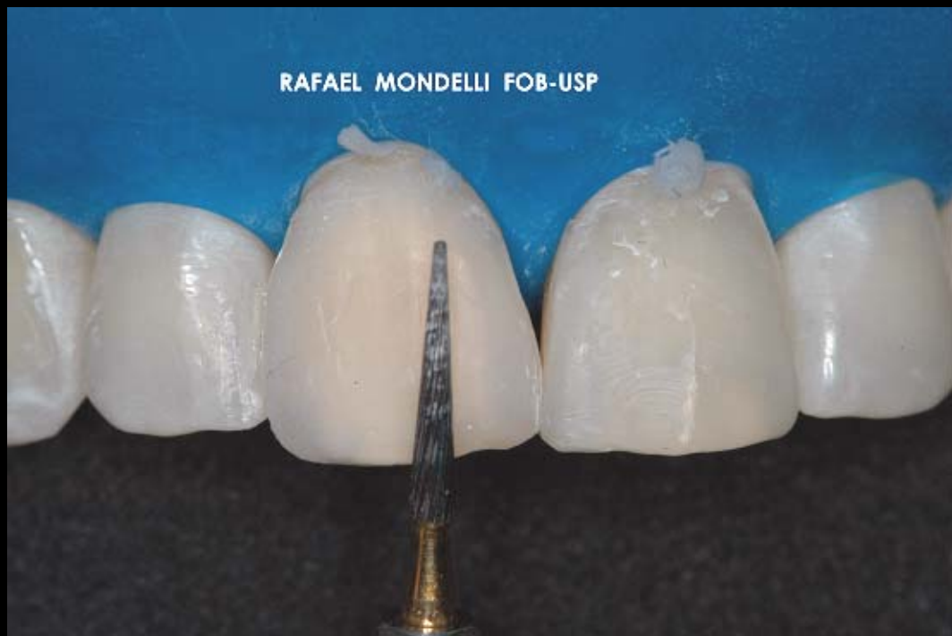
Figura 11 – Início do acabamento com broca multi-laminada (12 e 30 lâminas).