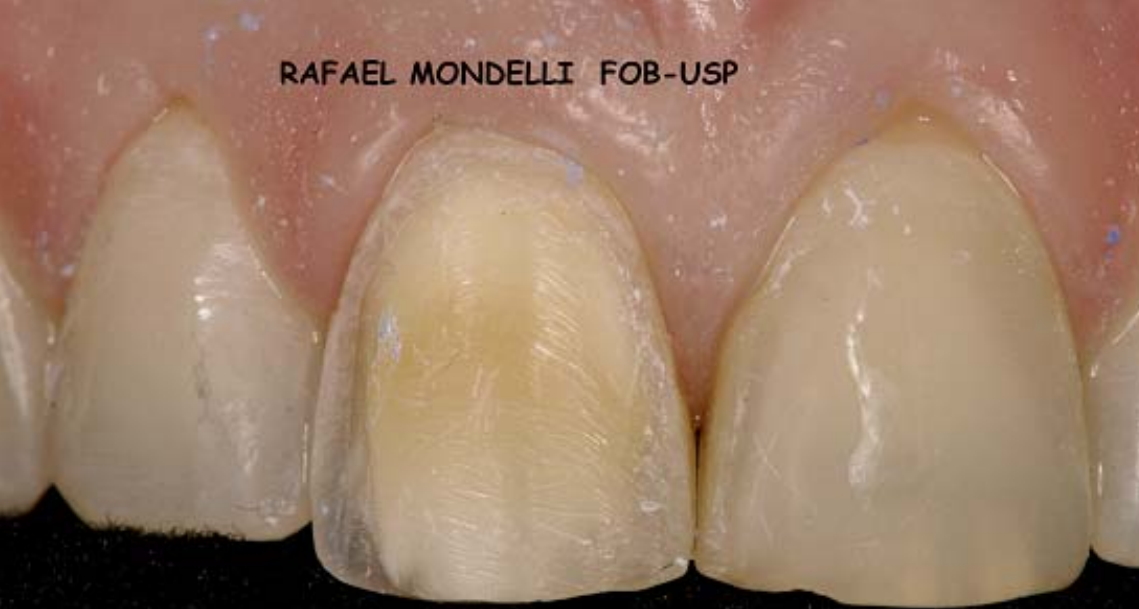
Figura 4 – Vista frontal do dente preparado para receber a faceta direta de resina composta.