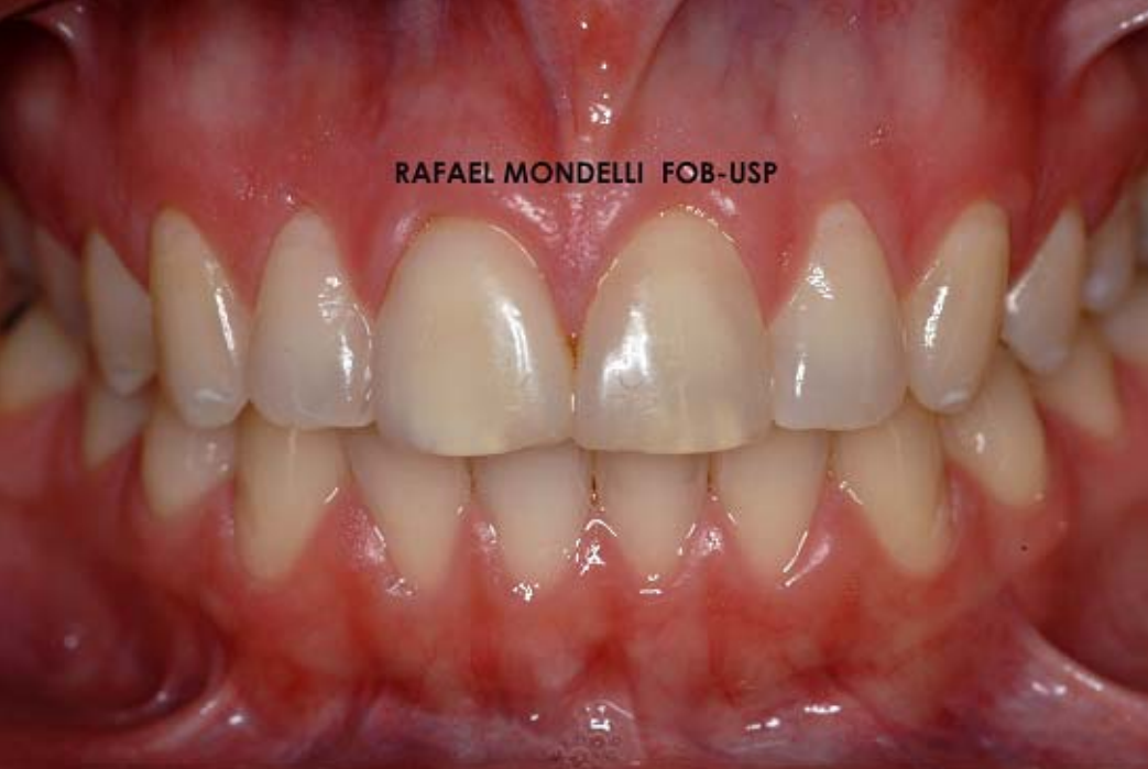
Figura 14 – Análise do resultado estético final após hidratação dos dentes. Notar a caracterização intrínseca realizada durante a confecção da faceta estética no IC superior direito, em semelhança ao IC esquerdo.