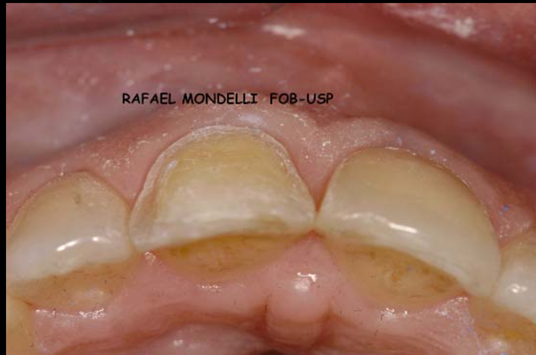
Figura 5 – Vista Incisal do dente preparado.