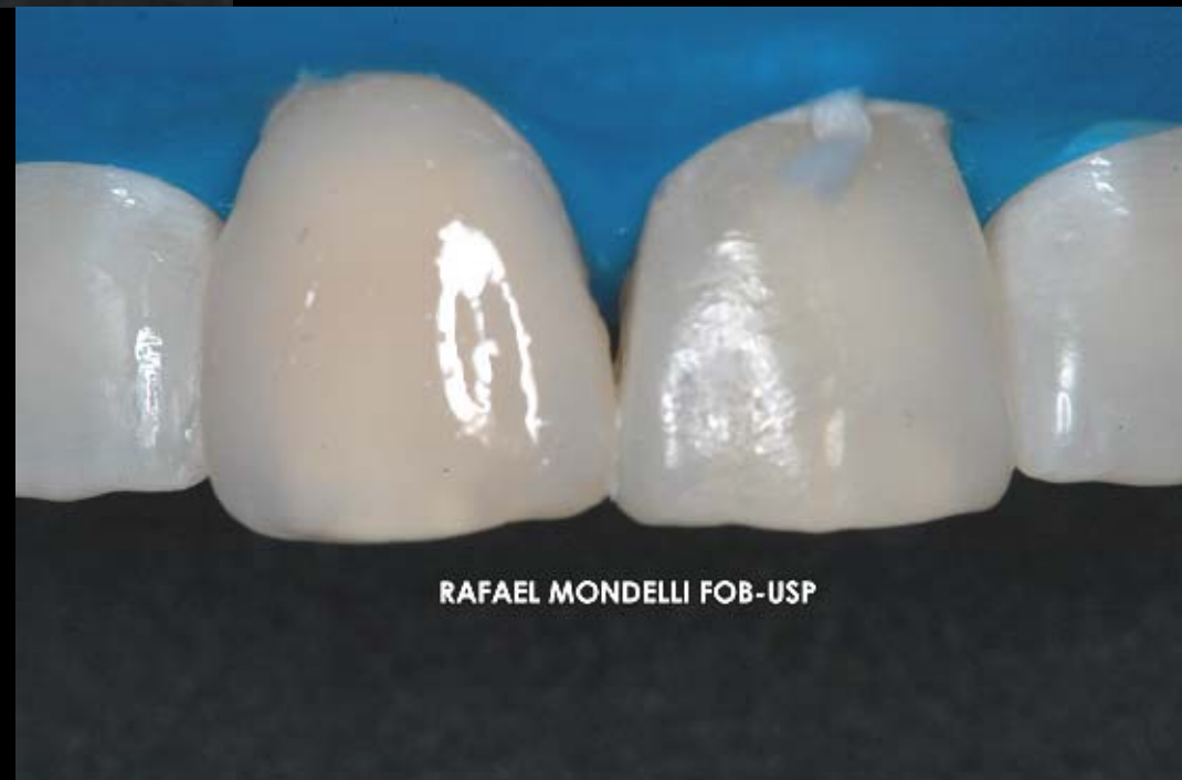
Figura 13 – Aspecto imediato do polimento conseguido da resina composta Esthet-X (Dentsply) utilizada na confecção da faceta direta de resina composta.