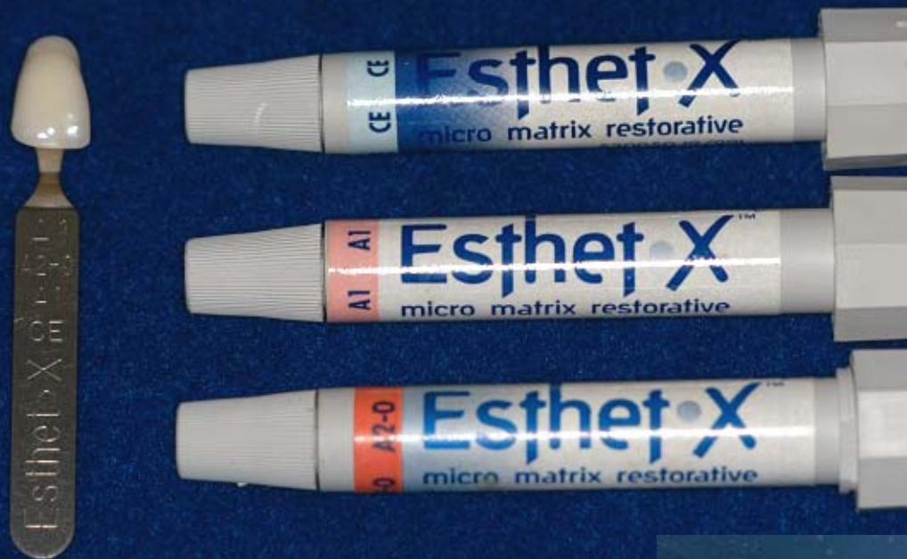
Figura 8 – Cores da resina Esthet-X utilizadas: A2-O (opaco); A1 (corpo) e CE (esmalte).