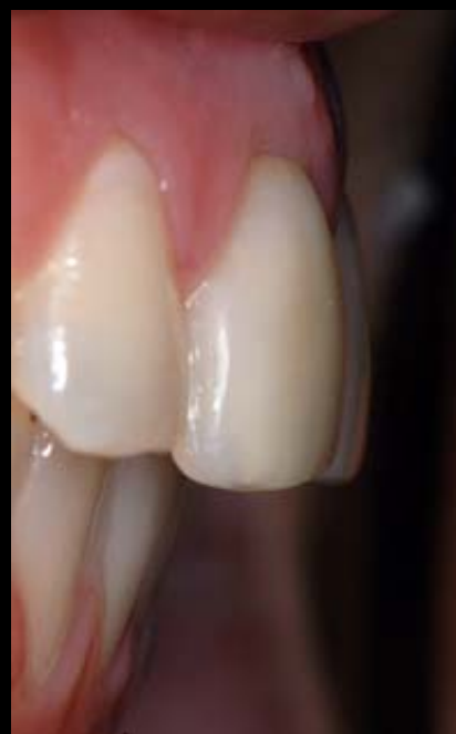
Figuras 15 A e B – Vista lateral dos dentes da paciente após clareamento e confecção da faceta de resina composta no IC direito.