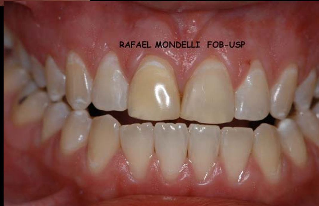
Figura 3 – Resultado imediato do clareamento realizado em consultório (1 sessão de atendimento) com energia de LED e Laser (Ultrableu IV – DMC Equipamentos) + Peróxido de Hidrogênio a 35% foto-sensível (Lase Peroxide – DMC Equipamentos).