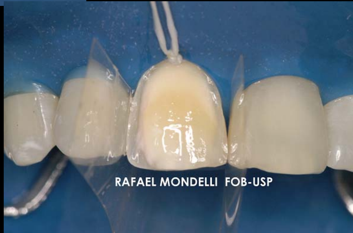
Figura 7 – Aplicação do sistema adesivo Prime&Bond 2.1.