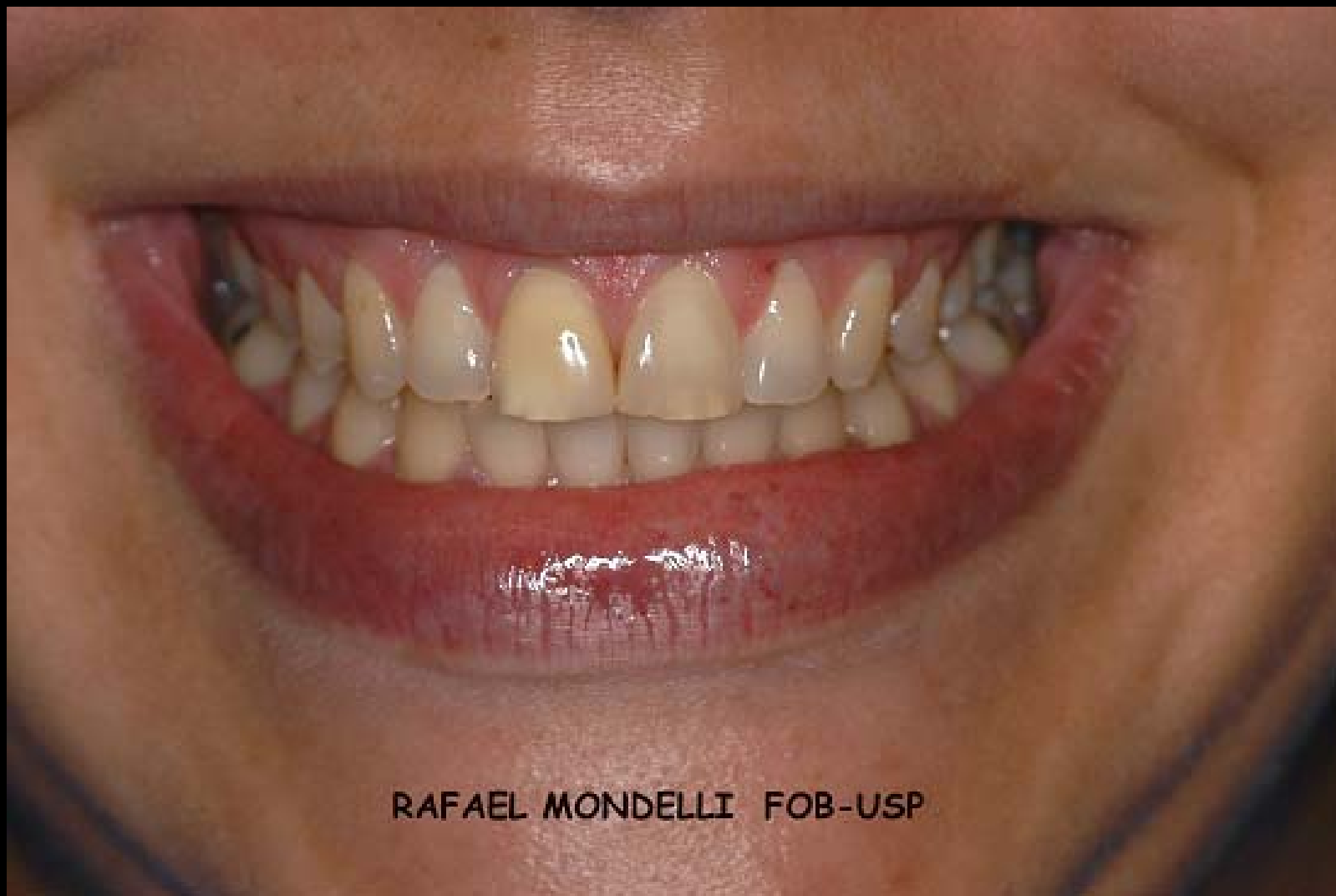
Figura 1- Sorriso da paciente, com os dentes escurecidos e o dente 11 com uma faceta de resina composta insatisfatória.