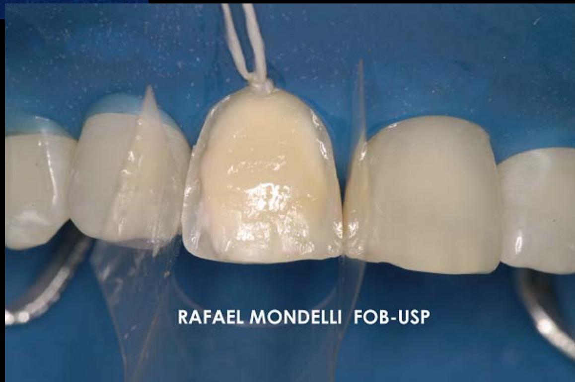
Figura 9 – Aplicação de uma camada com pouca espessura da resina Esthet X de cor opaca para dentina (A2-O).