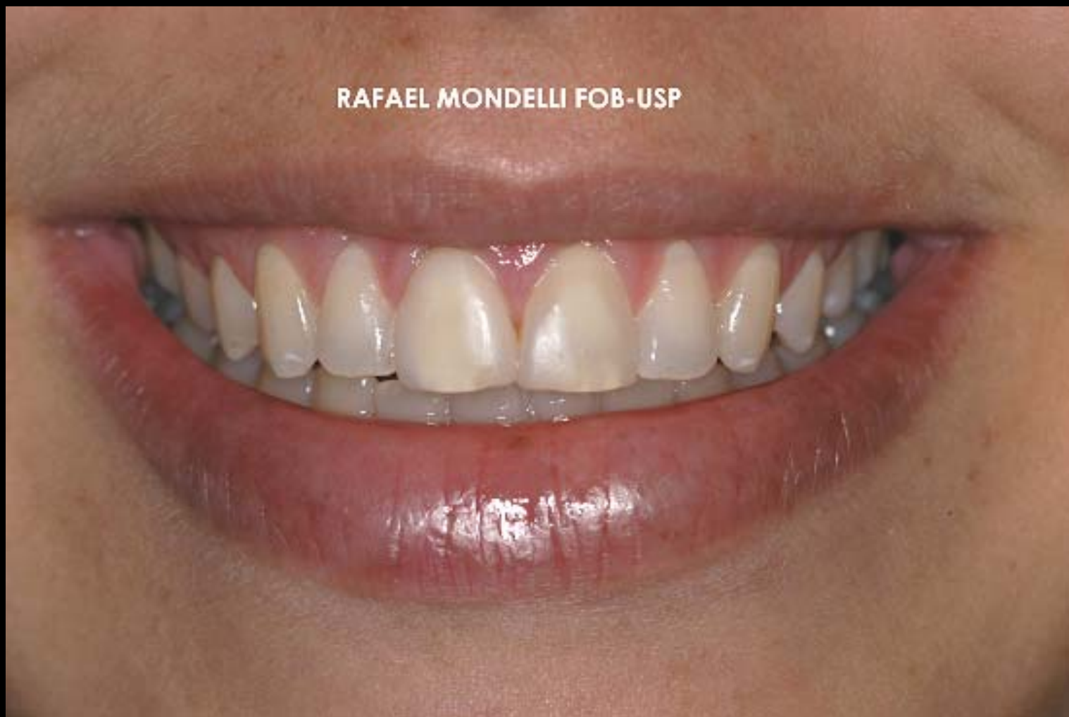
Figura 16 – Análise do sorriso da paciente. Observar o resultado estético conseguido após clareamento dental e confecção da faceta estética direta com a resina composta Esthet-X (Dentsply).