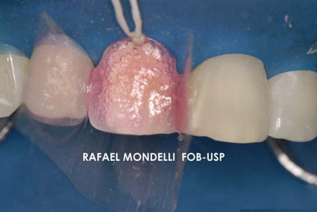
Figura 6 – Condicionamento com ácido fosfórico a 37% (30 segundos esmalte e 15 segundos dentina). Observar a tira matriz de poliéster protegendo os dentes vizinhos.