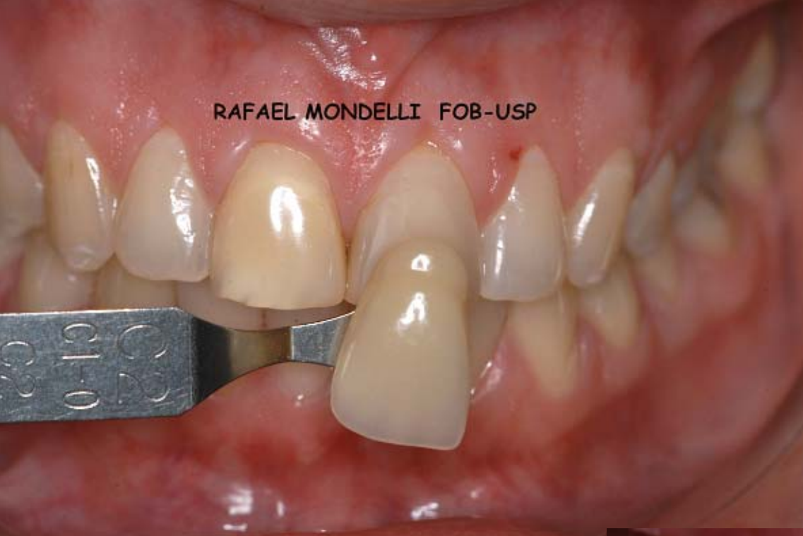
Figura 2- Escolha da cor dos dentes com escala de cor da resina composta microhíbrida Esthet X.