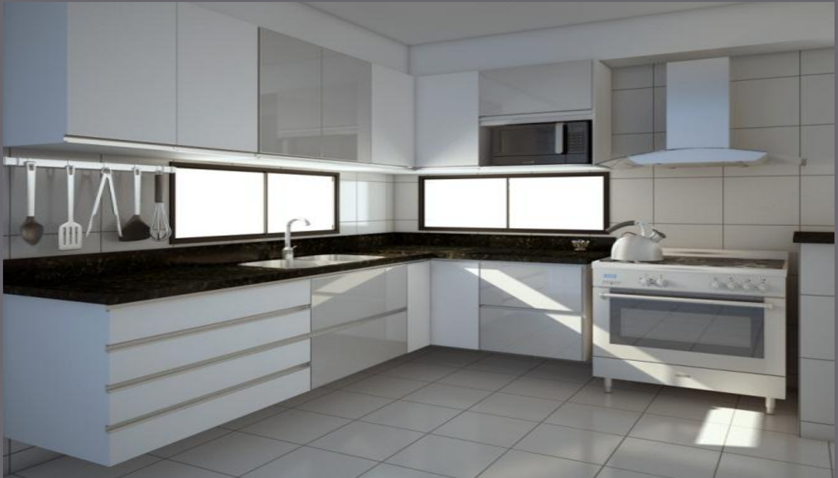
Perspectiva de uma cozinha