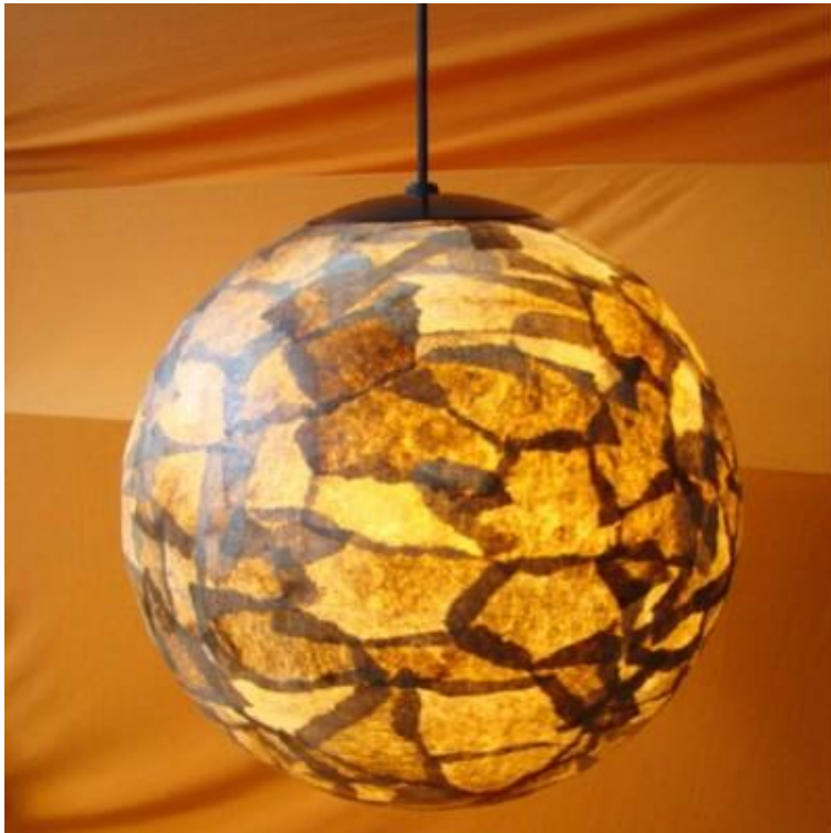
Lustre decorado com papel de filtro de café (Foto: Divulgação).

Antes de iniciar qualquer artesanato com o filtro de café é necessário sempre limpar e deixar eles prontos para a utilização.